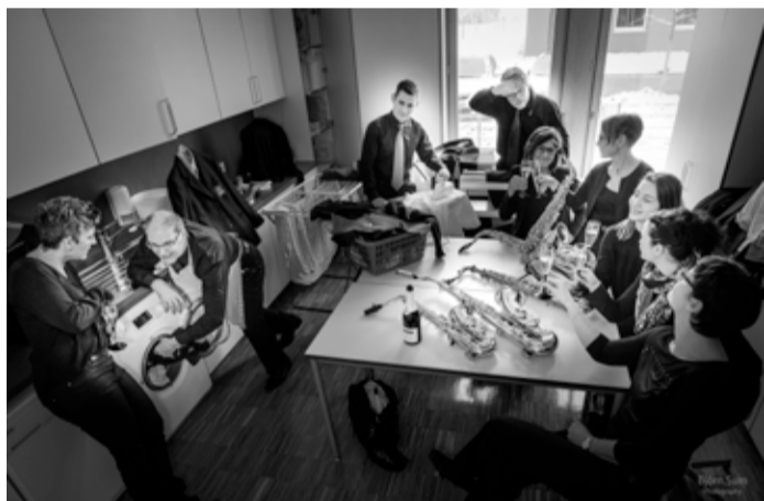
Alltag als Saxophonist...