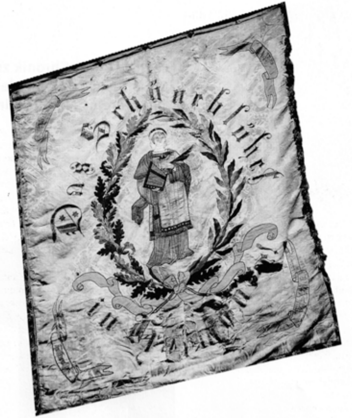
Bild rechts: Die historische Vereinsfahne des Musikvereins aus dem Jahr 1881, mit der Aufstickung „Das Schöne blühet in Harmonie“