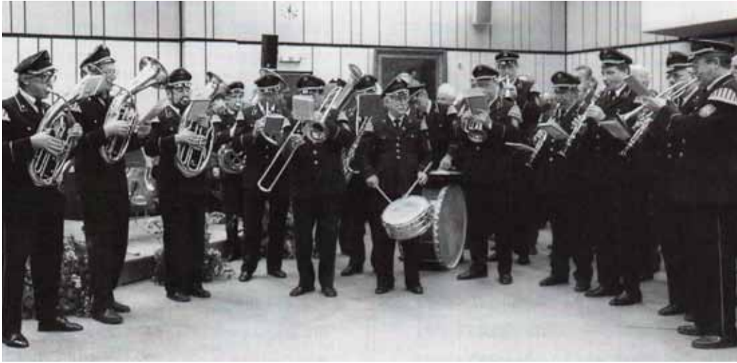
Ständchen beim SDR in Stuttgart, Leitende-Musikanten 1991