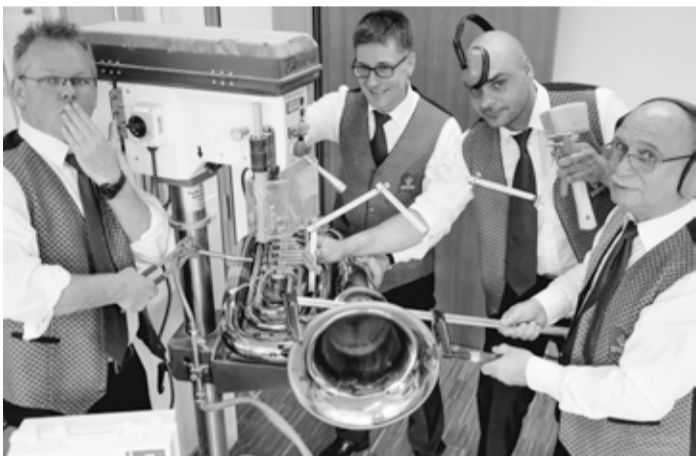
Tubisten beim Versuch operativ die Dynamik einzustellen.