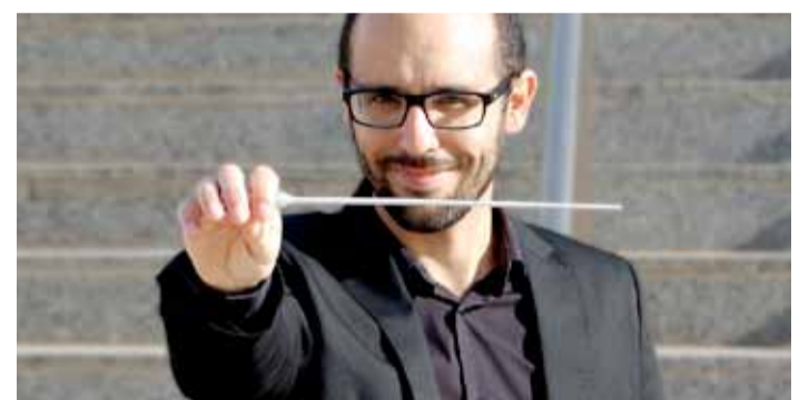
Komponist der Maltesia Suite und Gastdirigent beim Jubiläumskonzert: José Ignacio Blesa-Lull