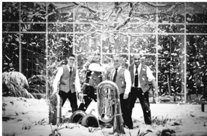
Nächster Versuch; durch Abkühlung der Köpfe und Bässe.