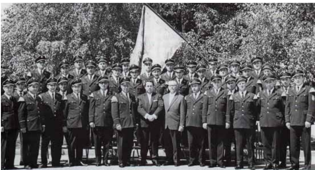
175 jähriges Jubiläum Musikverein 1968