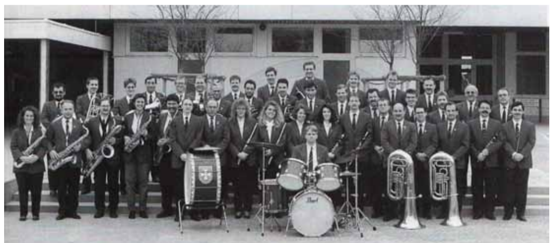
200 jähriges Jubiläum Musikverein 1993